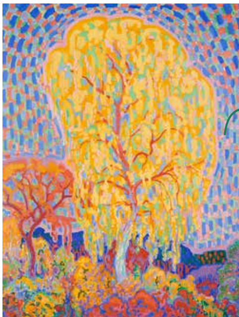
Dit schilderij Herfst van Leo Gestel is te zien op de eerste etage, maar heb je niet nodig voor de opdracht.