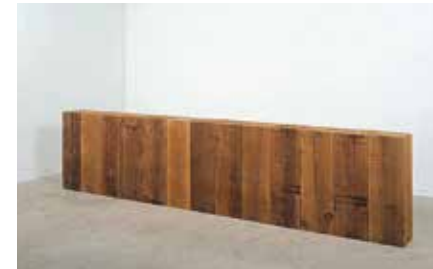
Titel: Palissade Te zien: Van Abbemuseum

7. Hoe heten de vierkante vormen die te zien zijn tussen de blokken?